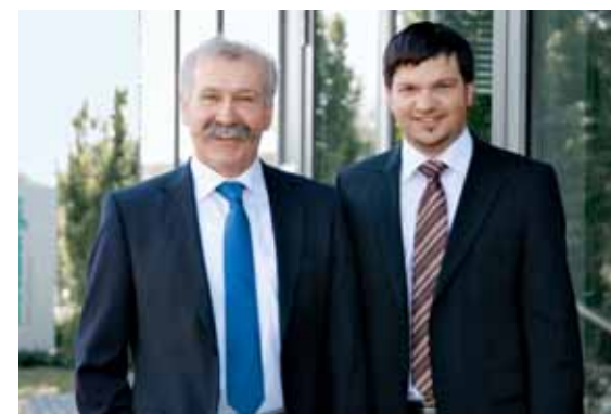
Außendienst - Wir sind in Ihrer Nähe Field service - we have somebody near you