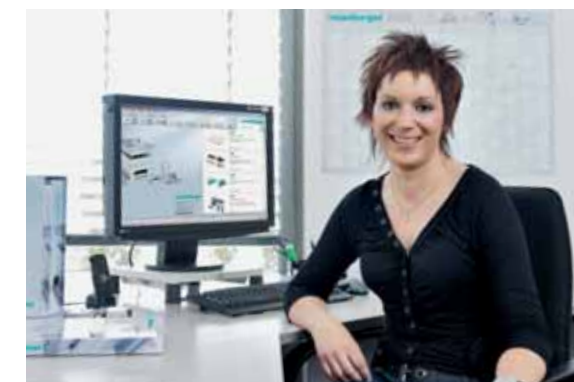
Innendienst - Wir kommunizieren in 11 Sprachen In-house customer service - we communicate in 11 languages