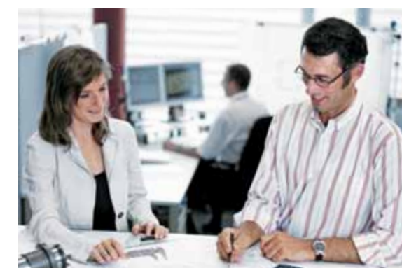
Experten - Wir unterstützen Sie in allen Fachbereichen Experts - we support you in all specialist areas