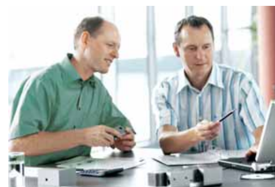
Produktmanager - Wir bieten Ihnen ein Top Know-how Product managers - we provide excellent practical know-how